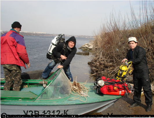
Фотосъемка в процессе погружения (обучения водолазов).