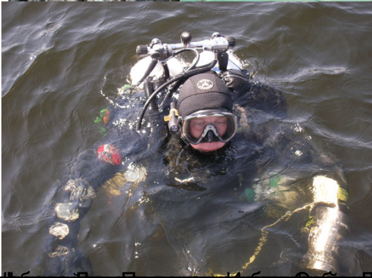
Фотосъемка в процессе погружения (обучения водолазов).