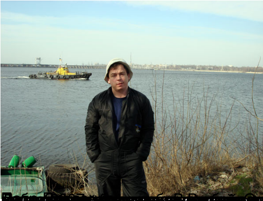
Парусный катер (бульвар) движется по реке