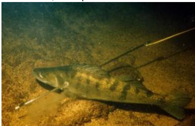
Судаку не повезло

Сильное течение и условия недостаточной освещённости создают экстремальные условия погру