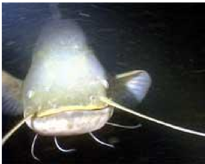
Ты кто? А я сом.

Во время одного из приездов журналистов Московского журнала "Рыболов" совместными усилиями