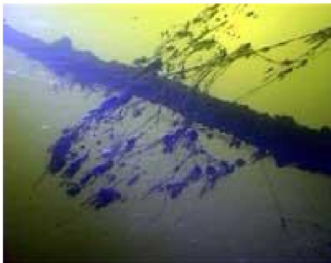
Брошенные сети ,это норма.