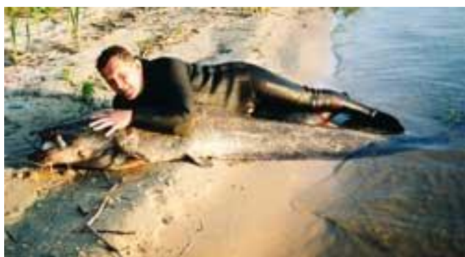
Добыча из Левковых ям.

Даже сейчас, в наше время, здесь не исключена встреча с сомами длиной два и более метров.