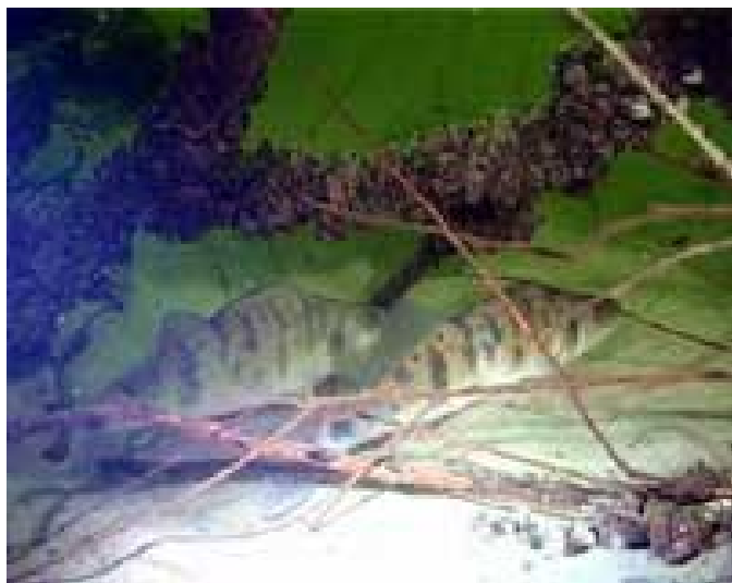
Судак в засаде.