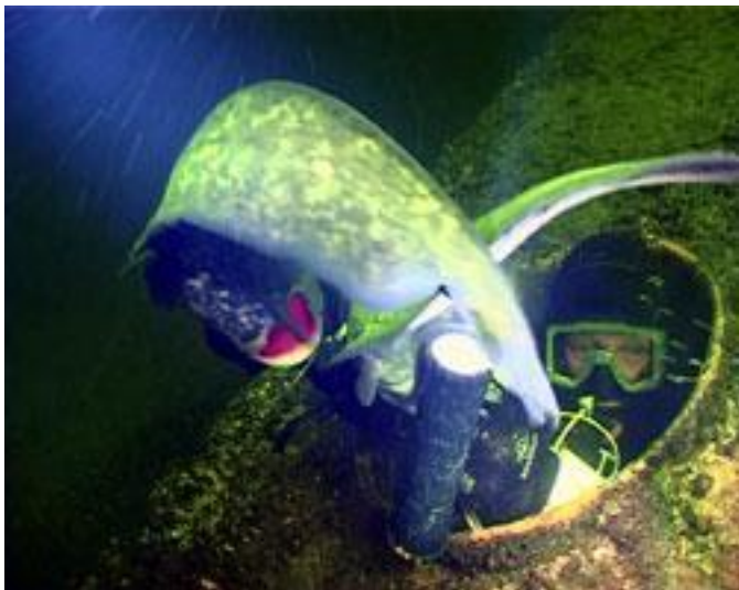
Сомы обжили wreck